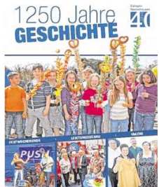
Die „MM“-Beilage zum Jubiläum ist jetzt auch online einsehbar.

Sämtliche Infos rund ums Jubiläum, die Leistungsschau und den Umzug finden Interessierte in der gestern erschienenen „MM“-Jubiläumsbeilage, die auch online unter www.morgenweb.de durchgeblättert werden kann. Die Beilage ist bei der Leistungsschau zudem am Stand der Gemeinde erhältlich. ago