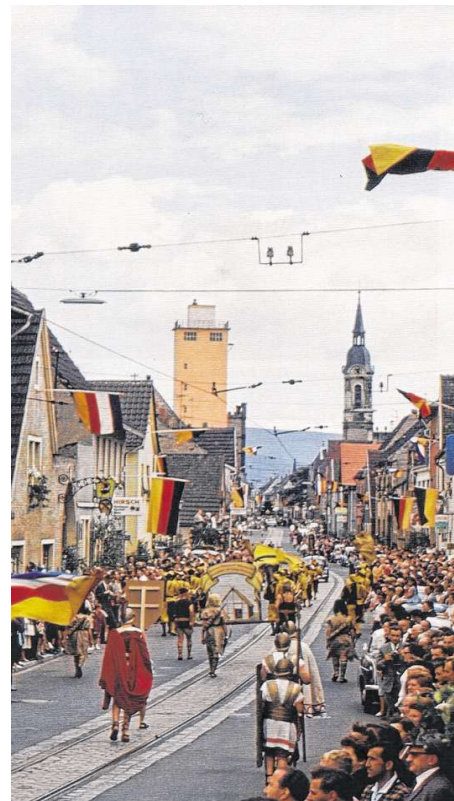
Ein Bild aus früheren Tagen: Auch 1965 freuten sich die Schaulustigen in Edingen über einen großen Festzug, damals aus Anlass der 1200-Jahrfeier.