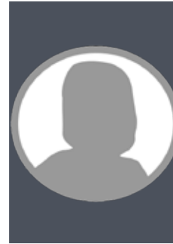
503 Maier, Angelika Angestellte 1966 Neckarbischofsheim