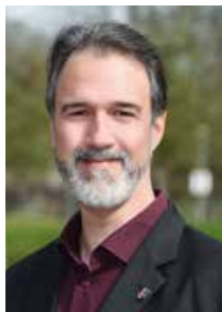
408 Daners, Andreas Freier Architekt 1974 Edingen-Neckarhausen