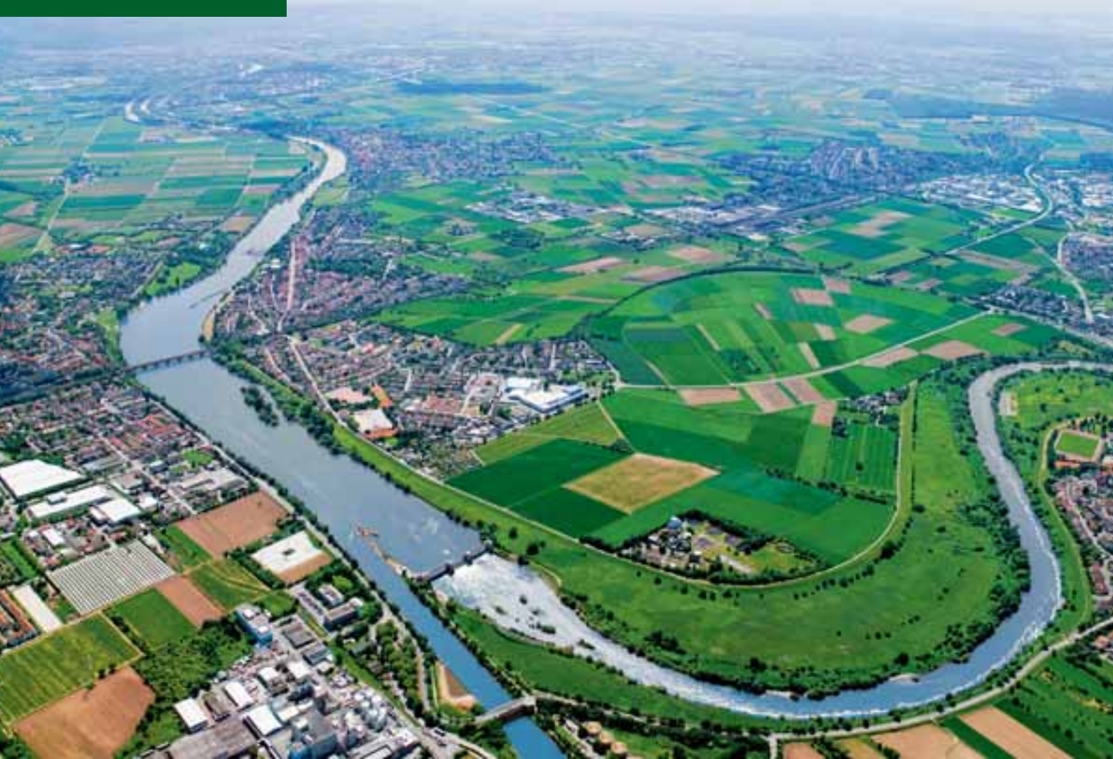
Die Neckarschleife bei Edingen-Neckarhausen aus Richtung Mannheim aufgenommen. In der kleinen Gemeinde sind neben alteingesessenen Unternehmen auch viele junge Betriebe ansässig, die die zentrale Lage zwischen den Oberzentren Mannheim und Heidelberg schätzen.