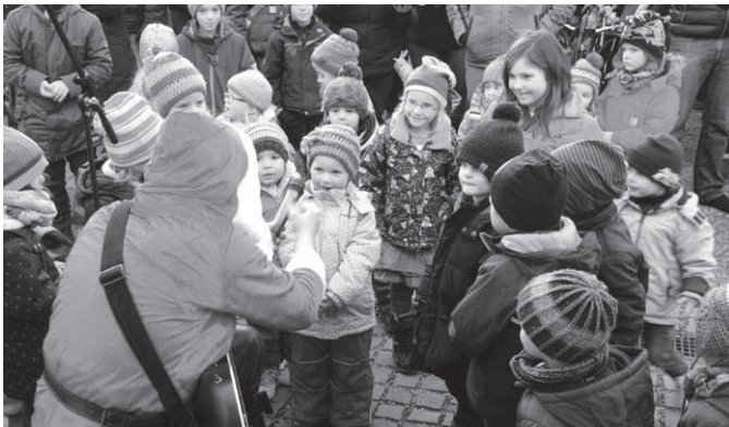
Herzliche Begrüßung durch den Nikolaus