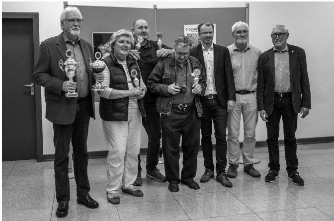
Siegerehrung