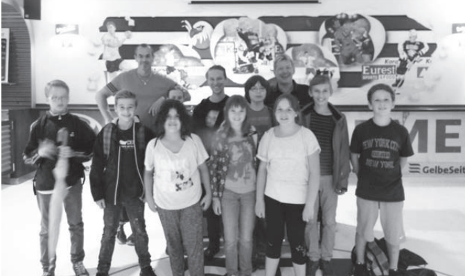
Besuch in der SAP-Arena

In der vergangenen Woche ging es zur SAP-Arena sowie der Falknerei auf dem Heidelberger Königstuhl.