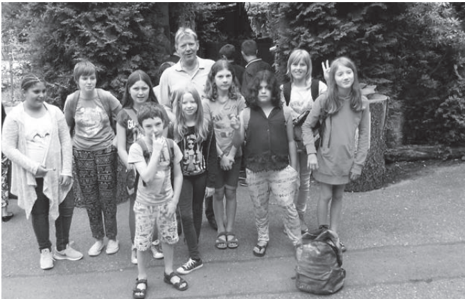
Besuch beim Falkner

Die Fahrt in den Kletterwald fiel dem tollen Sommer zum Opfer – morgen klappt das wohl wieder.