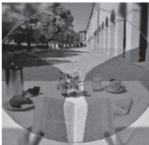
Standard, basierend auf statistischen Durchschnittswerten

PS: Wir bieten Ihnen auch einen umfassenden Reparaturservice für Uhren und Schmuck.