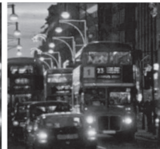
Links ohne, rechts mit DNEye®, bei gleicher Stärke!

GROSS 1866 Hauptstraße 14 · 69221 Dossenheim · Besuchen Sie uns · www.gross-1866.de