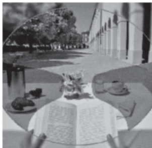
DNEye®: 100% deutsche Ingenieurskunst