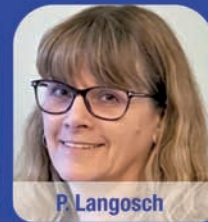
P. Langosch Vermietung