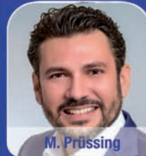
M. Prüssing Makler IHK