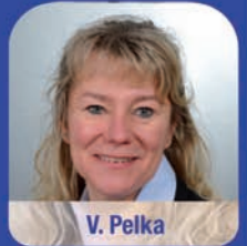
V. Pelka Korrespondenz