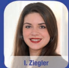
I. Ziegler Immobilienkauffrau