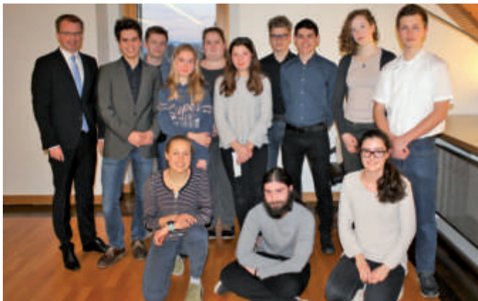
Verabschiedung und Neuverpflichtung des Jugendgemeinderates