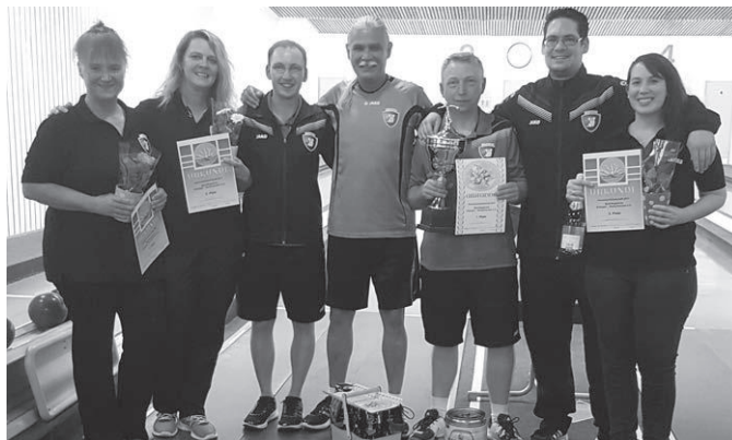
Vereinsmeister 2017