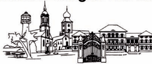
EDINGEN-NECKARHAUSEN Eine europäische Gemeinde