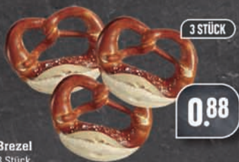
Brezel 3 Stück

von Montag-Samstag von 8.00-21.00 Uhr geöffnet auch sonntags von 7.30-11.00 Uhr geöffnet