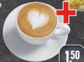
Ein Kaffee + eine süße Verführung