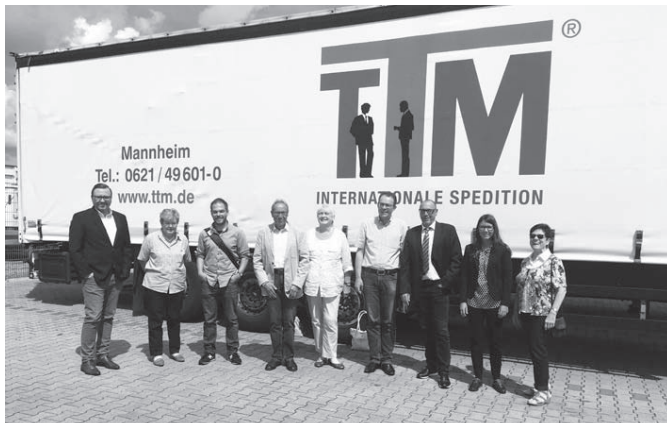
Besichtigung der TTM-Spedition