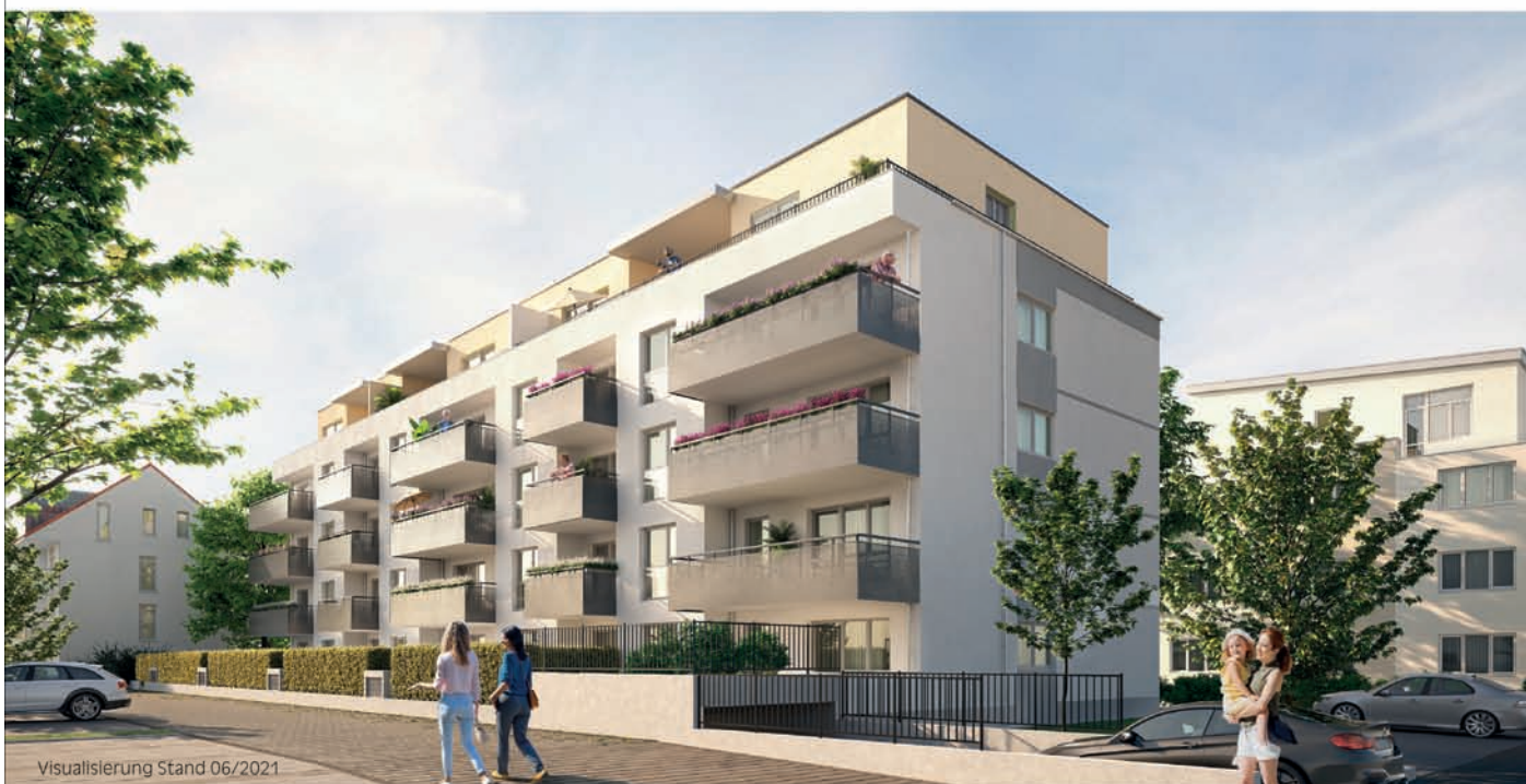
Visualisierung Stand 06/2021

Baubeginn erfolgt – Jetzt vormerken lassen