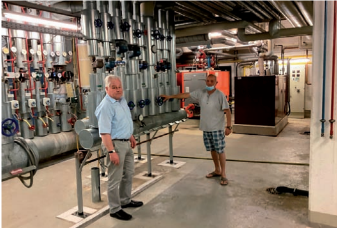
Ohne die technischen Anlagen ist kein Badebetrieb möglich

In der ersten Junihälfte werden zudem die Reparaturen und Instandhaltungsarbeiten sowie die Überprüfung der im Kellergeschoss installierten technischen Einrichtungen weitestgehend abgeschlossen sein. Denn gerade die „verborgene Technik“ ist mit den vielen Pumpen, Filter- und Aufbereitungsanlagen, Ventilen und Regulatoren usw. das Kernstück unseres Freizeitbads.