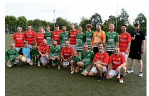
Sporttag: Beim Spiel der Gemeindevertretungen siegte die französische Equipe mit 3:1 – trotz Regen war es ein toller Spaß