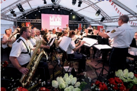
Die Musikvereinigung feierte ihren 100. Geburtstag: Das Polizeiorchester Mannheim (im Bild) und die SRH-Big-Band spielten dabei groß auf

Gerhard Hund, Marcus Schwetasch (MM), Nicoline Pilz (RNZ), Joachim Hofmann (RNZ), Gemeinde & Vereine Sicherlich haben Sie dafür Verständnis, dass die Auswahl an Bildbeiträgen nur auszugsweise die vielen Ereignisse und Veranstaltungen der Jubiläumsfeierlichkeiten wiedergeben können.