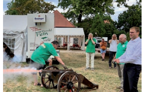
Eröffnung des 40. Gemeindefestes „Rund ums Schloss“ mit Böllerschüssen der Neckarhäuser Schützen