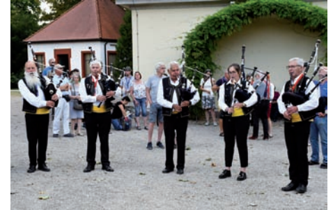
Bretonische Musik mit der Musikgruppe „Bagad Bro Even“