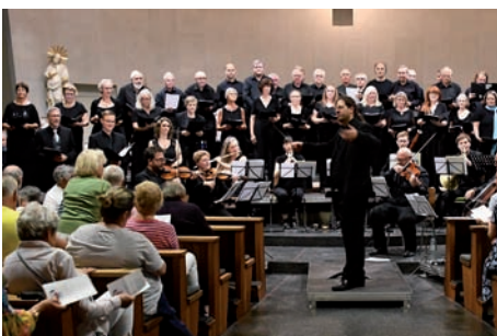
Begeisterndes Chorkonzert in der St. Andreas Kirche