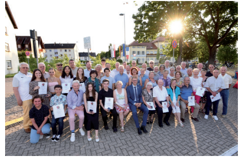
Ehrungsabend für „die Besten der Gemeinde“: Erfolgreiche Sportler und Kulturschaffende sowie Ehrenamtliche wurden ausgezeichnet