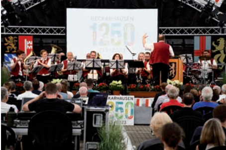
Stimmungsvoller Auftakt der Jubiläumsfeierlichkeiten „1250 Jahre Neckarhausen“ mit der Musikvereinigung

„1250 Jahre Neckarhausen“, „100 Jahre Musikvereinigung“ und „55 Jahre Partnerschaft“