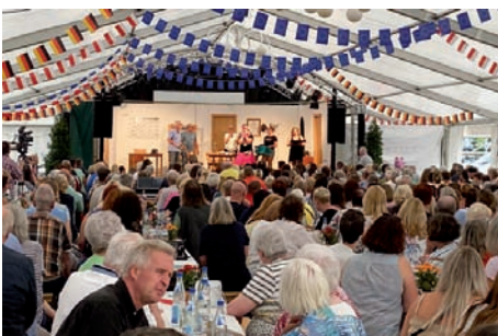
Mit dem Theaterstück „Für immer Disco“ sorgte die Laienschauspielertruppe des Gesangsvereins Neckarhausen für Lachsalven