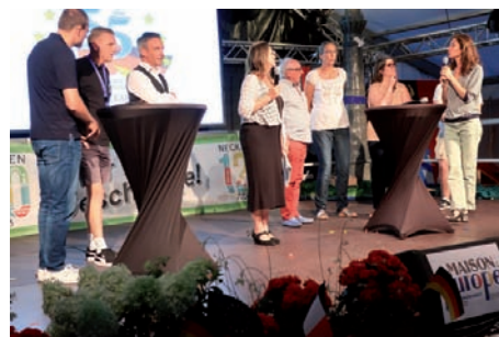
Beim Quizspiel des Europäischen Abends war auch Allgemeinwissen gefragt