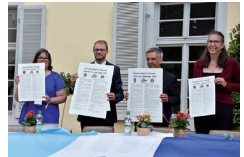
Unterzeichnung der Partnerschaftsurkunden – Es lebe die Partnerschaft