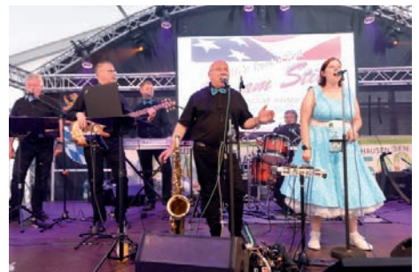
Die Oldi-Rock-n-Roll-Band „Eis am Stiel“ begeisterte mit Musik der 50er und 60er Jahre