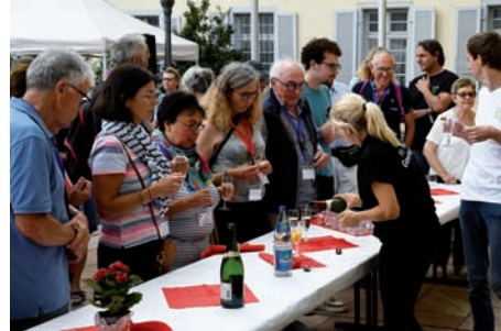
Begrüßungs-Aperitif im Schlosshof – Herzlich willkommen!