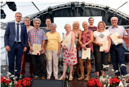
Hohe Auszeichnungen für mehrfaches Blutspenden – die Leistungen wurden gewürdigt