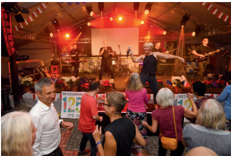
Beim Pop-Konzert-Abend am Freitagabend herrschte ausgelassene Stimmung