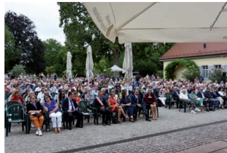
Festakt „55 Jahre Partnerschaft“ – Erneuerung der Partnerschaft im vollbesetzten Schlosshof