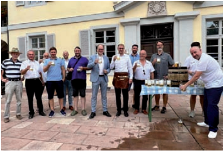
Traditioneller Fassbieranstich auf der Schlossterrasse mit vielen Ehrengästen