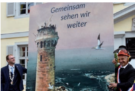
Das Bildgeschenk „Gemeinsam sehen wir weiter“ aus Plouguerneau darf auch als künftiges Leitbild für die Partnerschaft verstanden werden