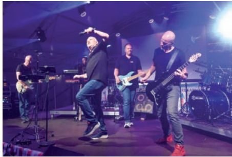
Die T-Band „rockte“ am ersten Jubiläumsabend das vollbesetzte Festzelt