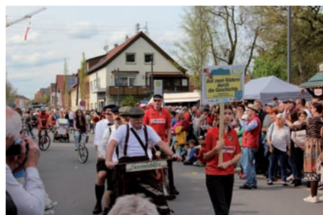
Der Radsportverein zeigte die Geschichte auf zwei Rädern