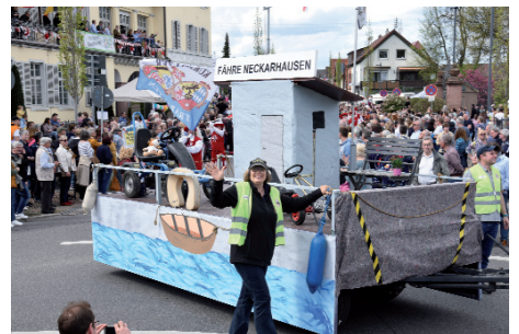
Die Fähre Neckarhausen verbindet