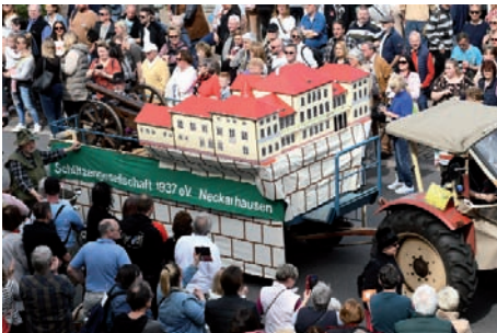
Das Graf-von-Oberndorff'sche Schloss – Sportschützengesellschaft Neckarhausen