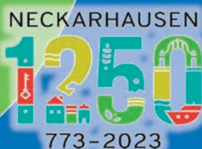
Florian König Bürgermeister