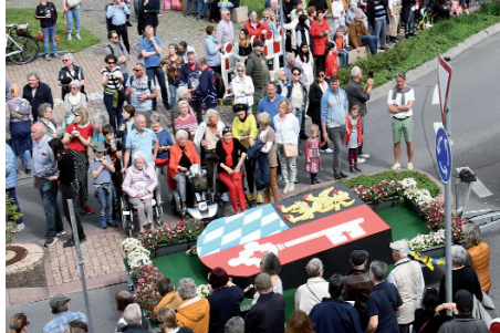
Das alte Wappenbild von Neckarhausen