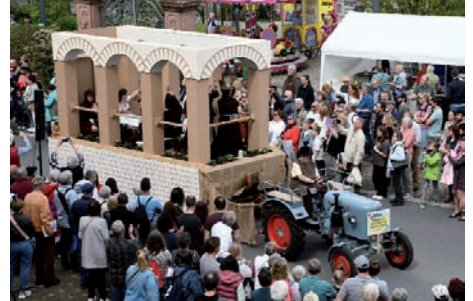
Die Schenkung der Cilina im Kloster Lorsch