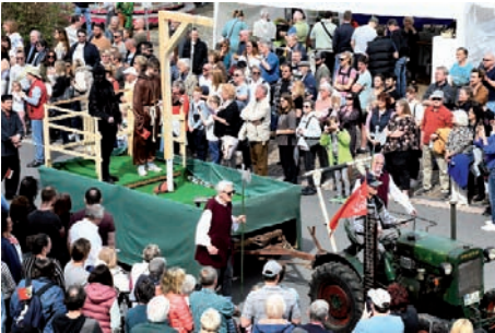
Die Gerichtsstätte des Lobdengaus zeigte der Motivwagen des Gesangvereins Neckarhausen