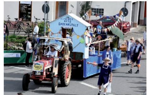
Das Metz'sche Badehaus – Turnverein Edingen