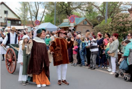
Der Landvogt zieht den „Zehnten“ ein