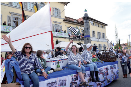
55 Jahre Partnerschaft: Edingen-Neckarhausen und Plouguerneau feiern