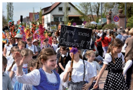
Das Schulwesen in den Anfangsjahren zeigte die Graf-von-Oberndorff-Schule