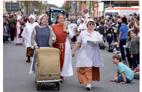
Die Landfrauen aus Edingen und Neckarhausen in historischen Trachten