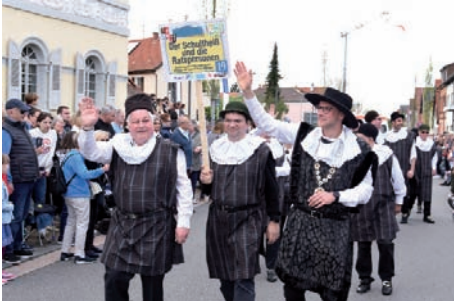
Der Schultheiß und die Ratspersonen