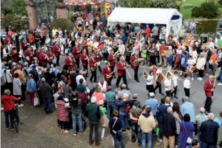
Die 100jährige Musikvereinigung eröffnet den Festumzug