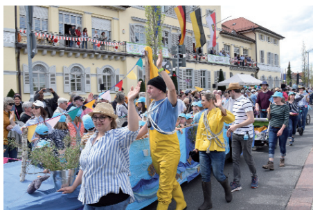
Die Berufsfischer und der Fischfang am Neckar mit den Kindergärten