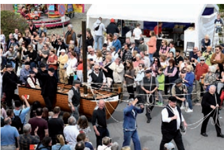
Die Schiffsreiterei, dargestellt durch den Gesangverein Neckarhausen