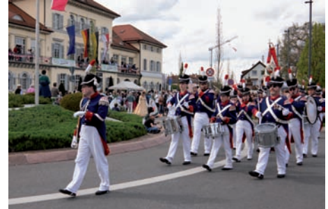
Historische Soldaten marschierten am Schloss vorbei