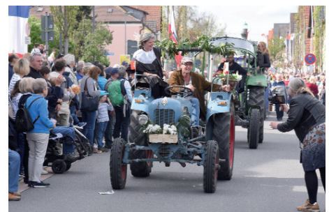
Große Traktorenparade der Schlepperfreunde