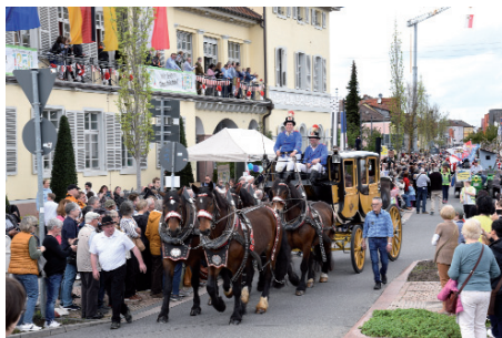
Die Fillbrunn – Susmann'sche Posthalterei mit Kutsche