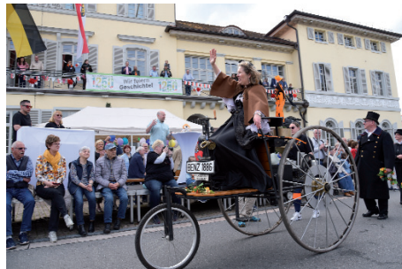
Berta Benz bei der ersten Automobilfahrt