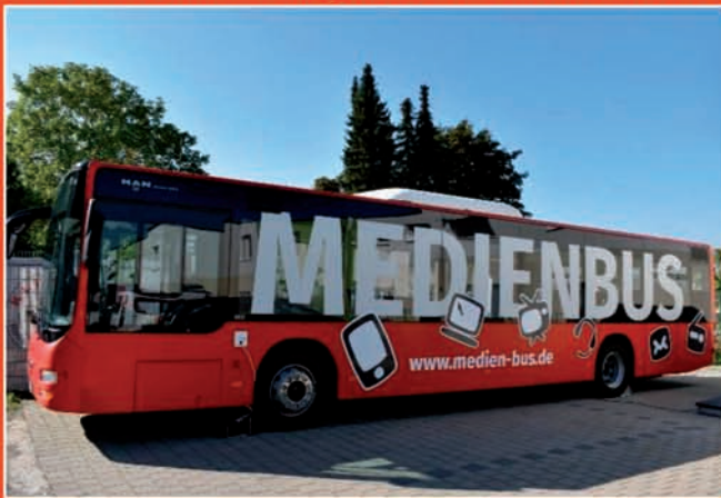
Bild: Mobile Medienhilfe vom Zentrum für Inklusion Weinheim ist unterwegs

Wie funktionieren eigentlich WhatsApp, Telegram oder Signal? Was tun, wenn ich meine Mails einfach nicht auf dem Smartphone finde? Wo ist die Datei hin, die ich doch gerade erst heruntergeladen habe? Wie klappt das am besten mit dem E-Paper der Lieblingszeitung? Wie finde ich die schnellste Bahn- oder Busverbindung über die RNV-App? Und wo bekomme ich diese App überhaupt her?