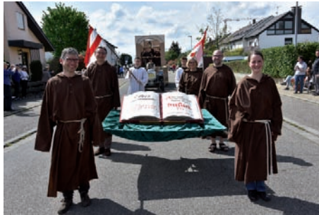
Erste urkundliche Erwähnung von Neckarhausen, dargestellt durch die Kirchengemeinden