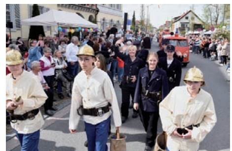
Die Brandschützer der örtlichen Feuerwehr in zeitgenössischer Montur