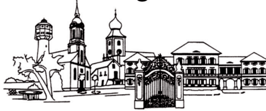
EDINGEN-NECKARHAUSEN Eine europäische Gemeinde