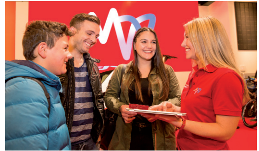
Die Maimarkt-Besucher sind herzlich eingeladen, MVV vom 28. April bis 8. Mai 2018 in Halle 35 zu besuchen.

Das Mannheimer Energieunternehmen MVV präsentiert bei Deutschlands größter Regionalmesse seine innovativen Produkte und Serviceangebote in der Halle der Metropolregion Rhein-Neckar (Halle 35). Damit können die Besucherinnen und Besucher des Maimarkts ihre ganz persönliche Energiewende Wirklichkeit werden lassen.