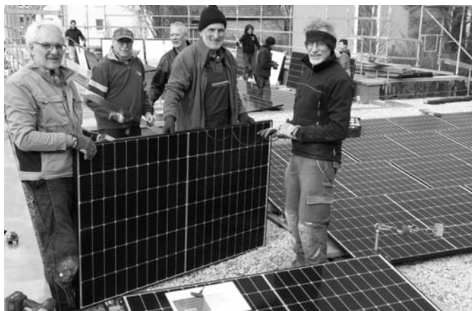
Die Ehrenamtlichen bei der Montage der PV-Anlage.